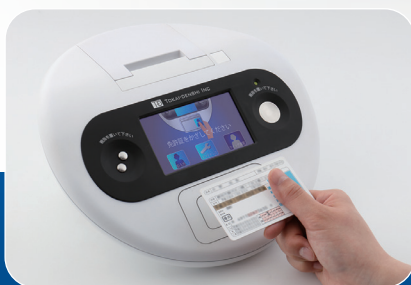
IC免許証で本人確認