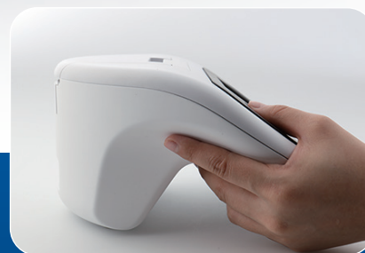
手のサイズに関わらず 安定した測定が可能