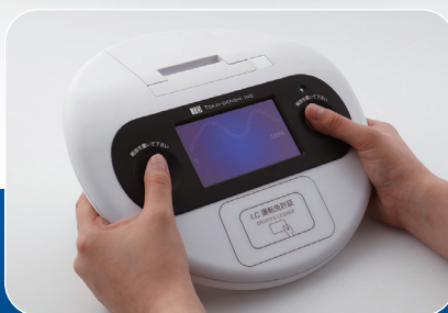
親指をセンサーに触れて 心拍数を計測